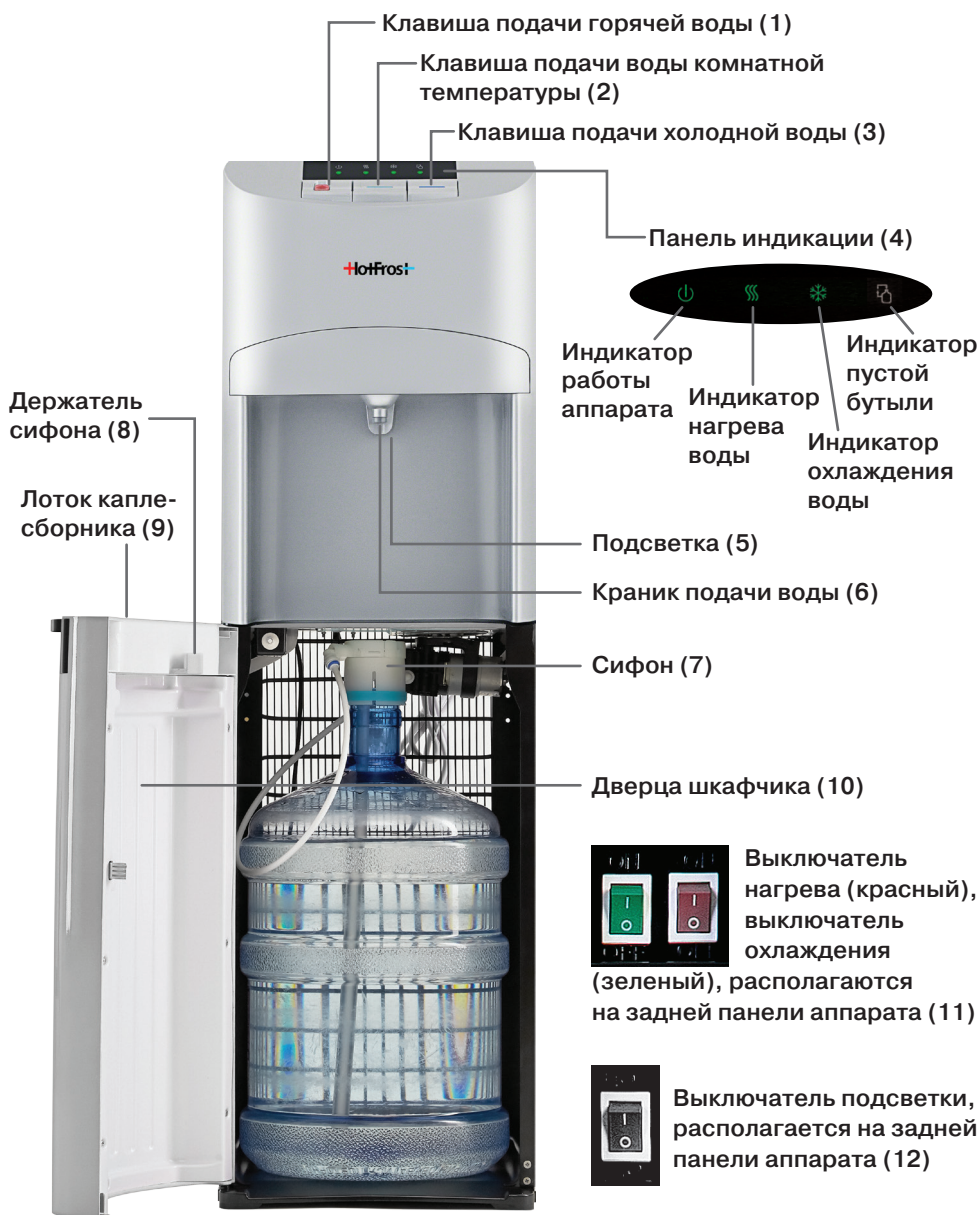
Рис. 1. Схема аппарата 45AS

Данный аппарат предназначен для нагрева и охлаждения питьевой бутилированной воды, расфасованной в поликарбонатные бутылки объемом 10–19 литров.