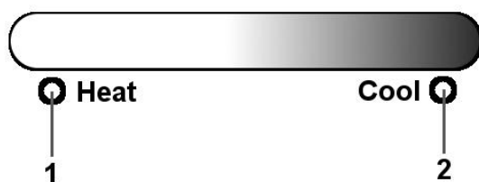
Рис.3 Индикаторная панель аппарата V710CE...

Горящий индикатор свидетельствует о том, что в данный момент аппарат производит охлаждение холодной воды. Наливайте холодную воду только тогда, когда данный индикатор погаснет. Для получения оптимальной температуры холодной воды, не наливайте сразу более двух чашек (около 500 мл).