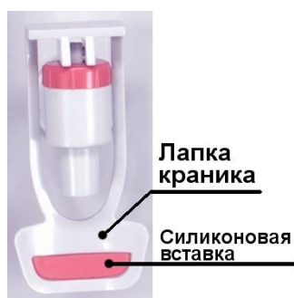
Рис.1. Краник горячей воды

Наливая горячую воду в чашку из краника-пуш, всегда нажимайте чашкой на часть лапки краника с силиконовой вставкой! Нажатие на пластиковый край лапки краника может привести к соскальзыванию чашки с лапки краника и попаданию на Вас каплей горячей воды. Никогда не нажимайте рукой на лапку краника горячей воды!